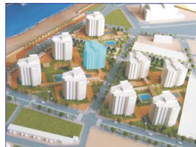
ESQUEMA DE URBANIZACION