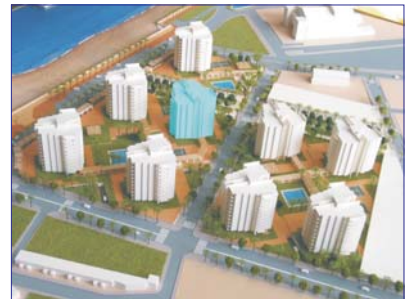
ESQUEMA DE URBANIZACION