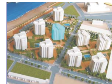
ESQUEMA DE URBANIZACION